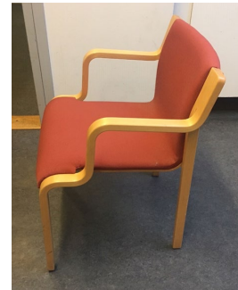
Lammhults: Opalen B. Lindau