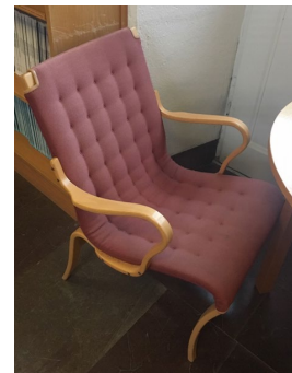
Bruno Mathsson: Mina (1942)