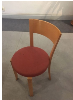
Gärnsnäs: S217 Åke Axelsson

Några exempel på (i offentlig miljö) frekvent förekommande hållbara produkter från mitten av 1900 talet. →