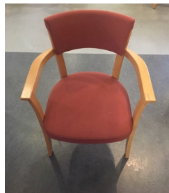
Gärnsnäs: S234 Åke Axelsson