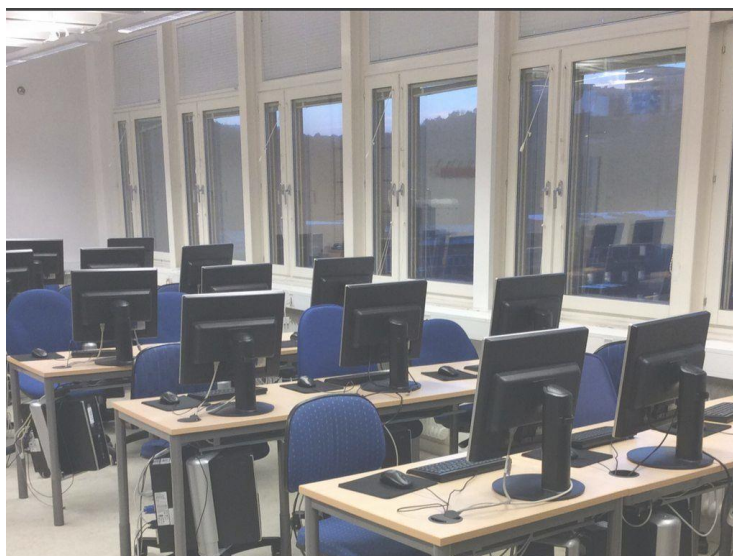
Lärosal före augusti 2016.

Studier av pedagogisk litteratur, men även vår egen känsla, övertygade oss om att studenterna skulle lära sig mer om de fick samarbeta kring olika problem och frågeställningar samt lösa praktiska uppgifter med oss som vägledare. I juni 2014 lämnade vi in vårt första önskemål om ny teknik; laptops, tv-skärm på vägg, och ändrad möblering. Detta skulle ligga som underlag för budget år 2015. I september skrev vi ett dokument (Bilaga 1) som skulle tjäna som teoretisk bakgrund och motivering