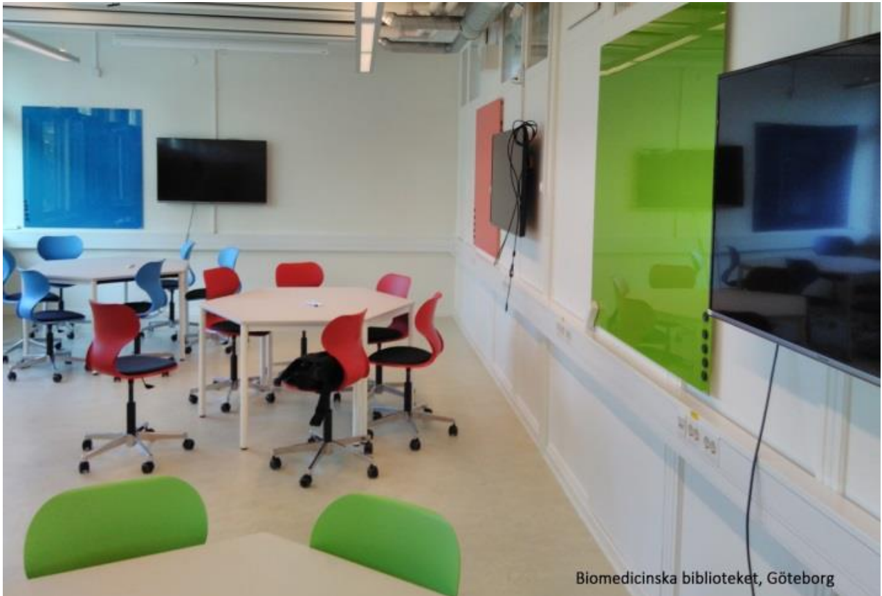
Lärosal efter augusti 2016.