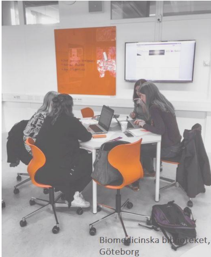
Biomedicinska biblioteket, Göteborg